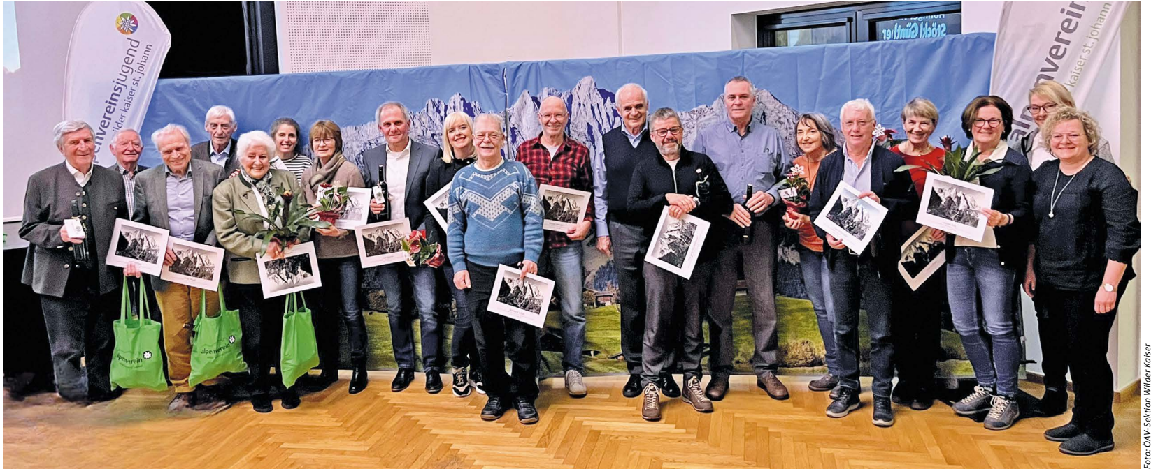
Bei der Jahreshauptversammlung wurden zahlreiche Mitglieder geehrt.

Die Sektion Wilder Kaiser ist einer der größten Vereine in unserem Bezirk und erfreut sich eines tollen Zuspruchs. Hunderte freiwillige Stunden ermöglichen es, unsere Touren zu planen und durchführen zu können. Die Arbeiten hinter den Kulissen, seien es der Schriftverkehr oder die Finanzen, benötigen sehr viele Stunden. Es wäre der Sektion schon sehr geholfen, wenn ein Umzug oder eine Datenänderung von Mitgliedern im Büro gemeldet würde. Wir erhalten aus Datenschutzgründen nämlich keine Nachfolgeadressen, und das erschwert unsere Arbeit beträchtlich.