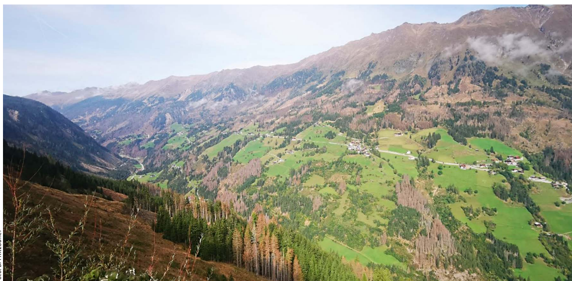
Borkenkäferschäden im Defereggental, Osttirol

Ursachen für die enormen Käferschäden sind einerseits der Klimawandel mit den wärmeren Temperaturen, welche die Vermehrung der Borkenkäfer auch in höheren Waldlagen sehr begünstigt, sowie die überalterten Fichtenbestände, die auch gegen Wind- und Schneeschäden deutlich anfälliger sind. Zudem bleibt frisch geschlägertes Holz bzw. Schad-